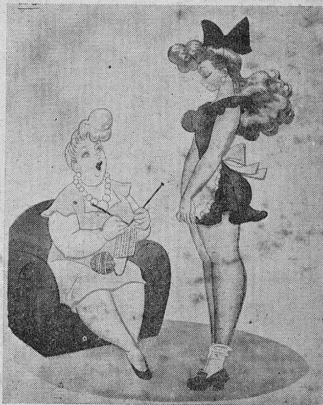
—Mamá, ¿puedo usar lápiz para los labios? He notado que los hombres empiezan a fijarse en mí...